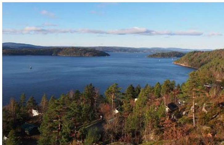
Utsikt nordover mot Digerud-Aspond og nordre Håøya. Herlig og ingen bro!

Alliansen Nei til bro over indre Oslofjord www.broneitakk.no jubler etter at regjeringen har valgt å gå inn for gjennomføringen av Oslofjordforbindelsen byggetrinn 2 i planen med en kostnadsramme på 4,5 milliarder kroner.