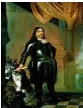
Den svenske krigerkongen Carl 10. Gustav, hersker i Sverige 1654-1660.