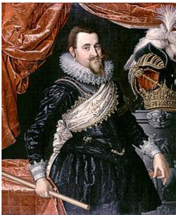
Kong Christian 4. dansk-norsk konge 1588-1648.

Etter den westphalske freden i 1648 var det forholdsvis rolig i Europa i noen år. Frankriges makt økte under Ludvig 14. (Solkongen som levde fra 1638-1715) og hans tre store kriger skulle på ny sette kontinentet i brann. Den fransk-nederlandske krig 1672-78, den pfalziske arvefølgekrig 1688-97 (niårskrigen) og den spanske arvefølgekrig 1701-14 kan sees på som direkte følgekriger av tredveårskrigen, med det tysk-romerske riket og Frankrike som hovedmotstandere. Det er i dag et nesten glemt faktum at Danmark-Norge deltok med ganske store styrker under den spanske arvekrig, ca 4000 norske soldater var med på britisk-nederlandsk side. Britene store militære leder under arvekrigen, John Churchill (den 1.hertug av Marlborough) sa at flere av hans slag hadde vært tapt, hadde det ikke vært for de dansk-norske styrkene. Dette gjaldt i særlig grad slaget ved Ramillies.