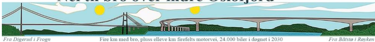
Fra Digerud i Frogn