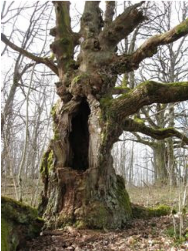
Gammel hul eik i Danmark naturreservat.

Opprettelsen av Danmark naturreservat medfører at det midlertidige vernet av Danmark landskapsvernområde oppheves.